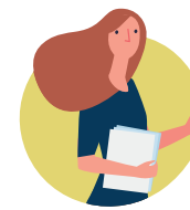
Pèsonèl ki pa ministeryèl.

Kowòdonatè afè entènasyonal ak biwo atache yo.