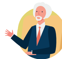
Ajan Ministè Piblik yo.

Chèf Inite Envestigasyon Krim pou Migran yo, ki responsab mekanis lan.